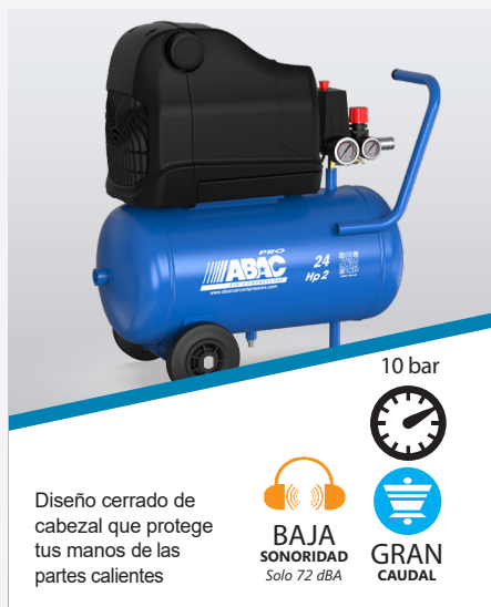
POLE POSITION OSS20P