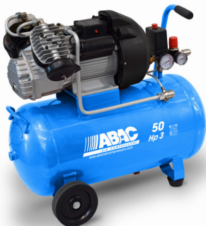
SPINN.E.I 7,5 10 200