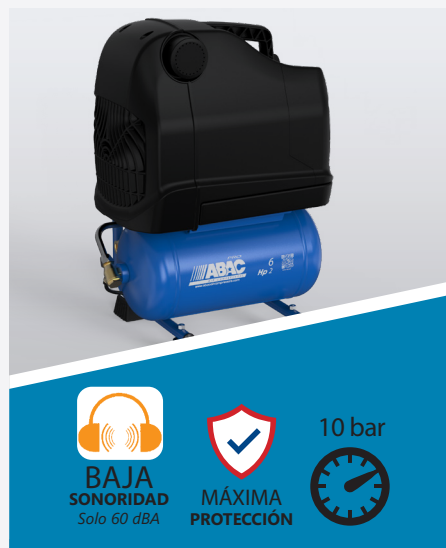
START OSS 20P